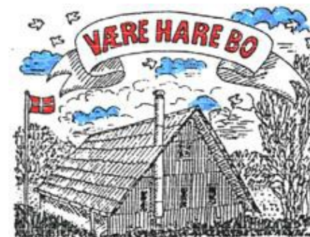
Spejderhytten Væreharebo Hove Møllevej 18 2765 Smørum